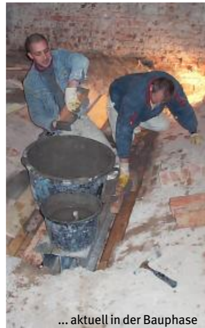
... aktuell in der Bauphase Fertigstellung März 2005